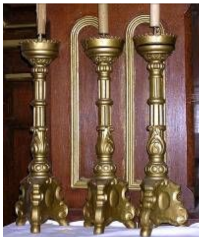
Dřevěné svícny na oltáři