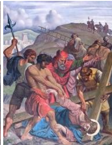
Zastavení 3., 5. a 9., ve 3. a 9. se jedná o pád Pána Ježíše pod křížem, v 5. zastavení Šimon z Kyrény je donucen pomoci Pánu Ježíši nést kříž.