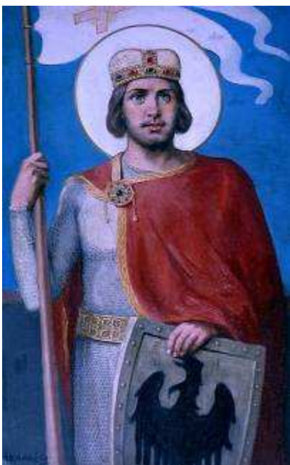
Svatý Václav v kostele na Dobeníně (Václavice)

V dávných dobách žili křesťanští rytíři. Cestovali světem a chránili slabé. Byli silní a odvážní, ale mnohem vzácnějšími vlastnostmi, než byla jejich tělesná zdatnost, byly jejich duševní vlastnosti. Vynikali především věrností, upřímností a pravdomluvností. Buď i ty upřímným přítelem PRAVDY, aby i o tobě směli lidé společně s Pánem Ježíšem prohlásit: „To je rytíř PRAVDY!“